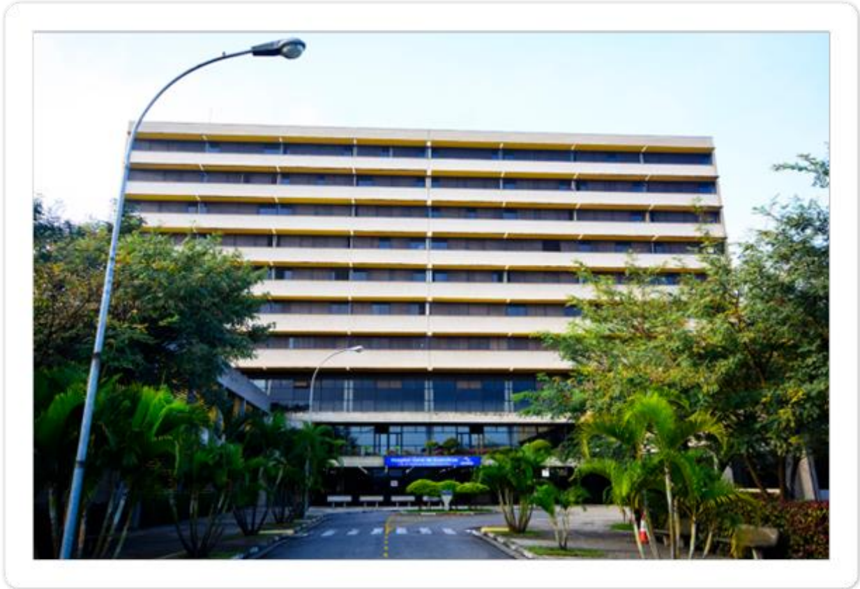
Hospital Geral Prof. Dr. Waldemar de Carvalho Pinto Filho de Guarulhos