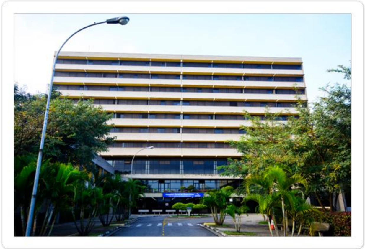
Hospital Geral Prof. Dr. Waldemar de Carvalho Pinto Filho de Guarulhos